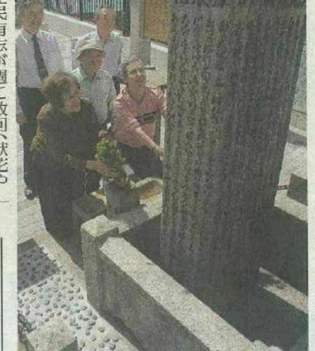
津波の被害を伝える石碑に献花する住民(大阪市浪速区で)

大阪に大津波、安政南海地震 江戸末期に発生した安政南海地震(1854年)の大津波の教訓を刻んだ石碑の保存活動に取り組んでいる大阪市浪速区幸町の住民らが、津波による被害の詳細や石碑建立のいわれなどを記録した冊子を作った。石碑は4月に市の有形文化財にも指定されており、住民らは「先人の貴重な遺訓を後世に伝える」として活動している。