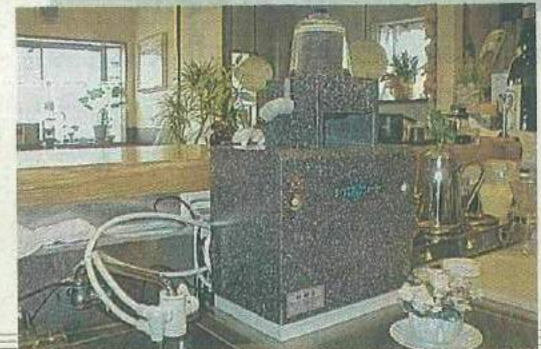
マシン・メンテナンス・サービス「ダイヤエアレスウォーター」

わずに手首に通して使う救命担架「レスキューシート」(出業商車)をプラスアルファ製品に認定した。製品は同機構のホームページ( http://www.higashi-osakabrand.jp )に掲載している。問い合わせは、市モノづくり支援室内の同機構事務局(06・4309・317)。